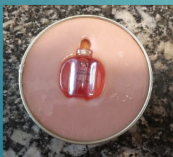
Positionnez le flacon sur le REPRO-GEL