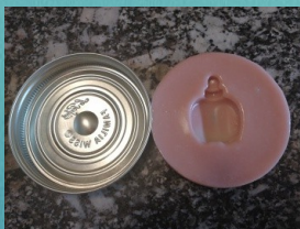
Une fois refroidit vous pouvez retirer le moule