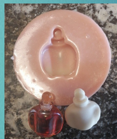
C'est parti ! Vous n'avez plus qu'à faire fondre de la Scultoline et commencer les moulages.

ET N' OUBLIEZ PAS ! Le REPRO-GEL est REUTILISABLE !!!