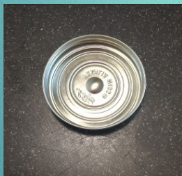
Un couvercle de boîte de conserve fera l'affaire