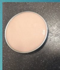
Attendez 2 à 3 minutes en déplaçant le moule afin de refroidir le fond.